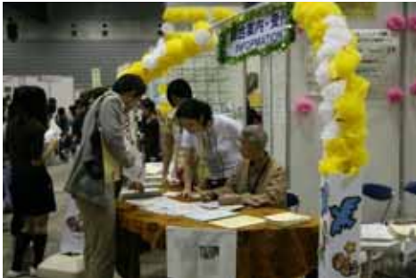
信息咨询站 凡有不明白处请到此咨询