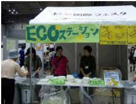
ECO 环保站 会场内垃圾请分门别类。