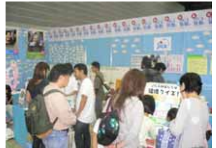
国际机构展位 让我们了解全球规模的市民运动。