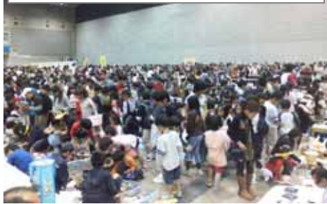
儿童跳蚤市场 买方卖方都是孩子们的天下！