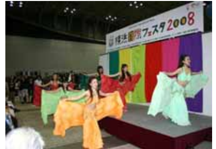
舞台表演 您可以亲眼观看世界各国舞蹈！！