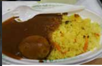
走走，看看， 今年能尝到什么奇珍妙味呢？