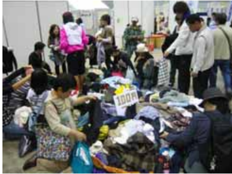
跳蚤市场 有大量宝贝可寻噢！