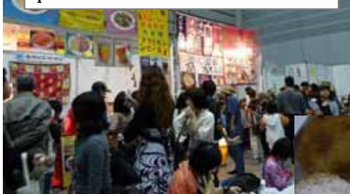
Foto do ano passado ( 昨年の写真 )